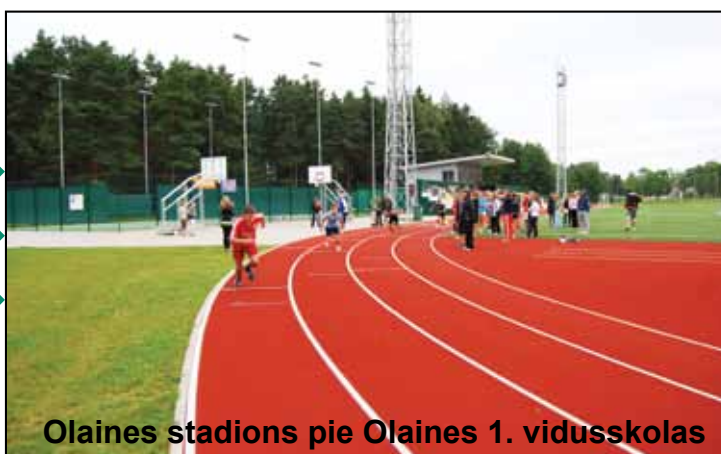
Olaines stadions pie Olaines 1. vidusskolas

Pateicoties projekta “Ūdenssaimniecības attīstība Olainē un Jaunolainē” Olaines komponente” realizācijai Olaines pilsētas iedzīvotāji un uzņēmēji saņem labas kvalitātes dzeramo ūdeni, kuru var izmantot gan uzturā, gan uzņēmumos ražošanas vajadzībām. Jaunās notekūdeņu attīrīšanas iekārtas un jaunu sadzīves un lietus kanalizācijas tīklu izbūve nodrošina ne vien lietusūdeņu nodalīšanu no sadzīves kanalizācijas ūdeņiem, samazinot attīrāmo notekūdeņu daudzumu, bet arī mazina apkārtējās vides piesārņojuma risku.