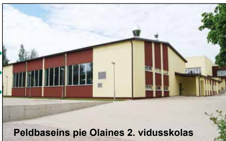
Peldbaseins pie Olaines 2. vidusskolas