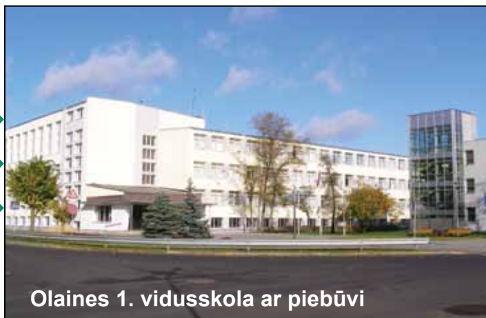
Olaines 1. vidusskola ar piebūvi