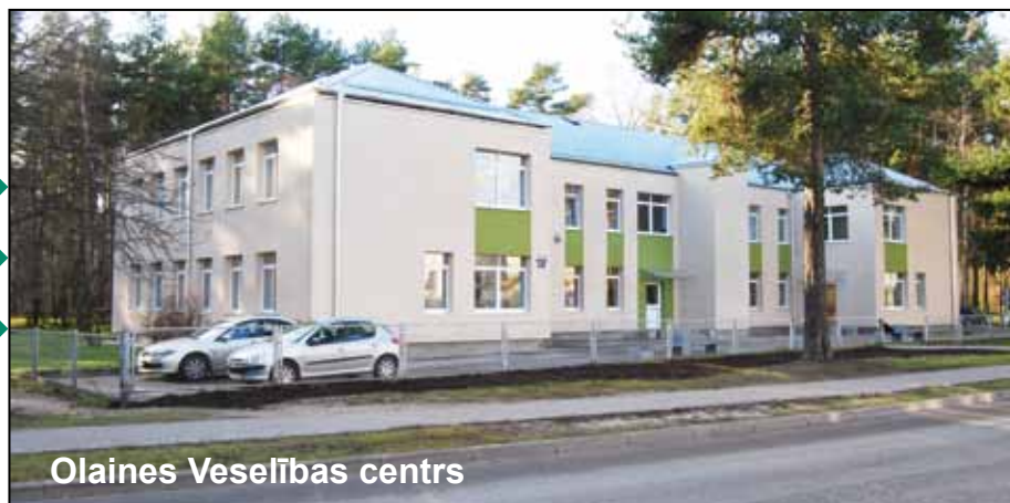
Olaines Veselības centrs