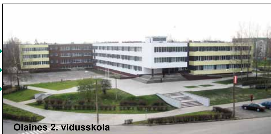
Olaines 2. vidusskola