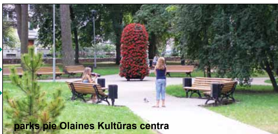
parks pie Olaines Kultūras centra