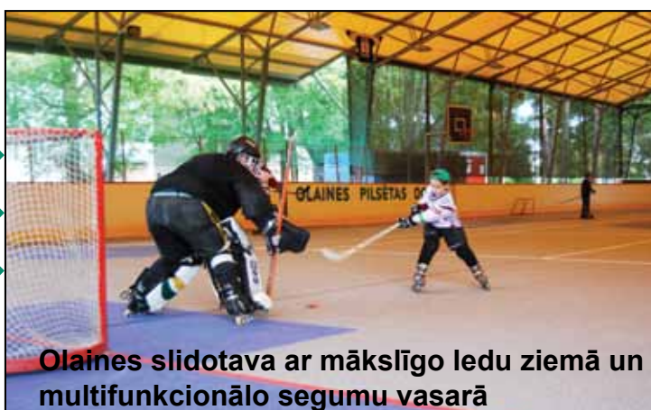
Olaines slidotava ar mākslīgo ledu ziemā un multifunkcionālo segumu vasarā